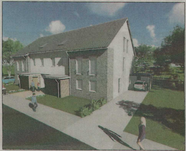
So soll ein Miet-Einfamilienhaus im neuen Baugebiet künftig aussehen.